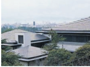
江戸川区スポーツセンター