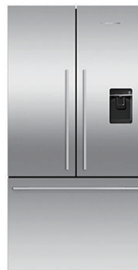
写真 FW0採用事例 家庭用冷蔵庫扉

FW0は、高性能且つコスト・セーピングな素材として、海外市場で先行して家庭用電機製品分野などでご採用頂いておりましたが、ステンレス市場の裾野の拡大を目指し、国内市場に本格投入することといたしました。